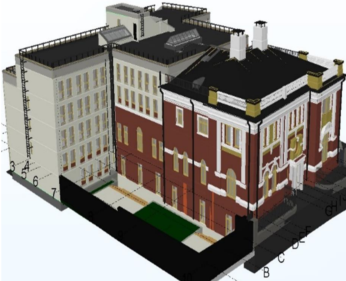
Kuva. Viron Moskovan suurlähetystö.

2015-16 Viron Moskovan suurlähetystö, Moskova (Tallinna)